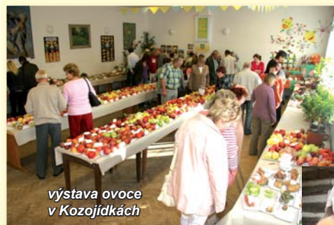
výstava ovoce v Kozojídkách