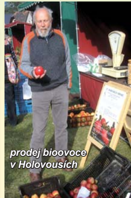
prodej bioovoce v Holovousích