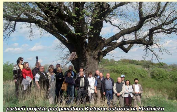
partneři projektu pod památnou Karlovou oskoruší na Strážnicku

Zavítejte i vy na český a moravský venkov za kulinárními zážitky do stínu starých ovocných stromů.