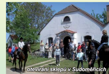
otevírání sklepů v Sudoměřicích

Více informací získáte na www.straznicko.cz .