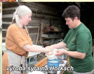
výroba sýra na Horkách