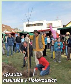
výsadba malináče v Holovousích

Oblast ležící v podhůří Krkonoš, známá ovocnářstvem a kameňáctvím. Úrodné půdy jsou vhodné pro pěstování ovocných stromů. Zdejšími pěstiteli byly vyšlechtěny slavné odrůdy jako je sladká třešeň Karšovka či Holovouské malinové jablko . Podchlumí je také krajem soch a kamenných památek, které můžete potkat na každém kroku. Projekt je zde zaměřen na obnovu a rozvoj tradičních trhů a slavností, vybavení pro jarmarky a kulturní aktivity oživující řemesla a tradiční produkty regionu.