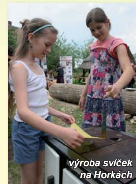
výroba svíček na Horkách