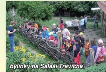
bylinky na Salaši Travičná