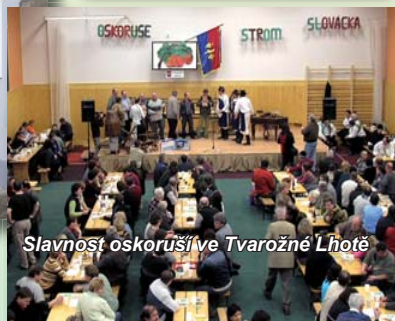
Slavnost oskoruší ve Tvarožné Lhotě