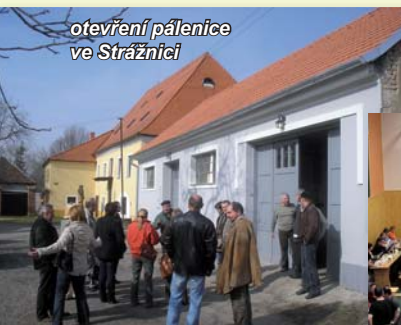
otevření pálenice ve Strážnici