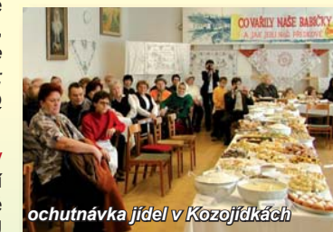
ochutnávka jídel v Kozojídkách

✿ Vinařský areál Starý potok, Sudoměřice - areál sklepů se zahrádkářským domem poskytující občerstvení a ubytování. Otevřeno: červenec - srpen pá - so 16.00 - 20.00, jinak na objednávku u p. Šredla; tel: 739 336 814, obecsudomerice@iol.cz, www.obecsudomerice.cz