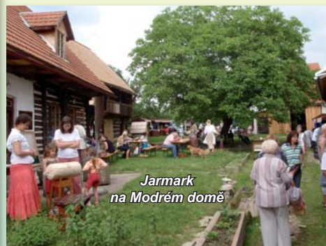
Jarmark na Modrém domě

Region podél Orlice je typický pastevní hospodařením v nivě, rozsáhlými lesy na starých terasách řek a podhorským zemědělstvím se sady a zahradami. Ovoce, zelí, jáhly a další plodiny byly v regionu typickými prvky běžného života na venkově a projektem usilujeme o jejich připomenutí a oživení. V rámci projektu dále mapujeme odrůdy ovocných dřevin. Mezi typické a dnes již vzácné patří jablka jako Košíkové , Smiřické či slivý Chrudimské . Podporujeme tradiční společenské akce a usilujeme o jejich obohacení o řemesla a produkty z tradičních plodin. V rámci projektu byly podpořeny nové akce: Horecký jarmark a Den řemesel, proběhly semináře pro zlepšení pohostinnosti a služeb . V projektu byly vysazeny ukázkové výsadby tradičních, regionálních odrůd ovocných dřevin také v Šachově, Ledské, Velinách, v Chlenech a ve Lhotách u Potštejna a dále se započalo s obnovou historického sadu s naučným panelem v Třebechovicích pod Orebem . Návštěvnícká místa jsou v regionu NAD ORLICÍ novým typem služby. V projektu byla podpořena tři návštěvnícká místa: