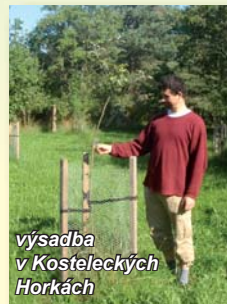
výsadba v Kosteleckých Horkách

Region podél Orlice je typický pastevní hospodařením v nivě, rozsáhlými lesy na starých terasách řek a podhorským zemědělstvím se sady a zahradami. Ovoce, zelí, jáhly a další plodiny byly v regionu typickými prvky běžného života na venkově a projektem usilujeme o jejich připomenutí a oživení. V rámci projektu dále mapujeme odrůdy ovocných dřevin. Mezi typické a dnes již vzácné patří jablka jako Košíkové , Smiřické či slivý Chrudimské . Podporujeme tradiční společenské akce a usilujeme o jejich obohacení o řemesla a produkty z tradičních plodin. V rámci projektu byly podpořeny nové akce: Horecký jarmark a Den řemesel, proběhly semináře pro zlepšení pohostinnosti a služeb . V projektu byly vysazeny ukázkové výsadby tradičních, regionálních odrůd ovocných dřevin také v Šachově, Ledské, Velinách, v Chlenech a ve Lhotách u Potštejna a dále se započalo s obnovou historického sadu s naučným panelem v Třebechovicích pod Orebem . Návštěvnícká místa jsou v regionu NAD ORLICÍ novým typem služby. V projektu byla podpořena tři návštěvnícká místa: